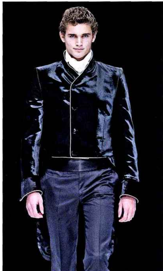
COUP DE CHARME