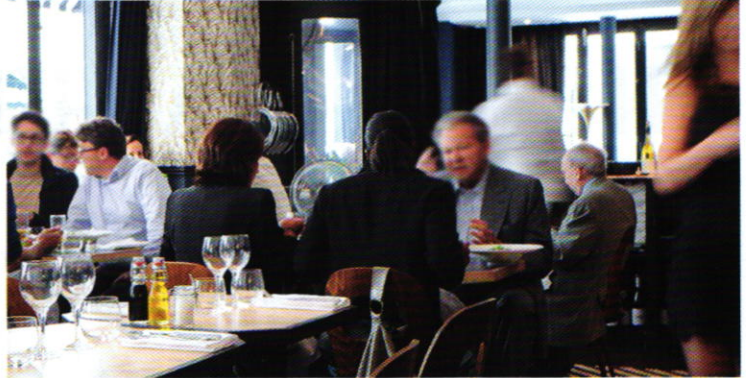
La Gazette - 28 rue de Duret 75016 Paris - 01 45 00 45 20

Il suffit parfois d'un décor pour ouvrir l'appétit. Celui de la Gazette est de ceux-là. La cuisine ne déçoit pas, de belles assiettes joliment préparées et jouant le dépaysement (Tempura de gambas au sésame) ou l'enracinement (Penne à la truffe et aux cèpes). N'oubliez pas de goûter à la somptueuse ganache au chocolat !