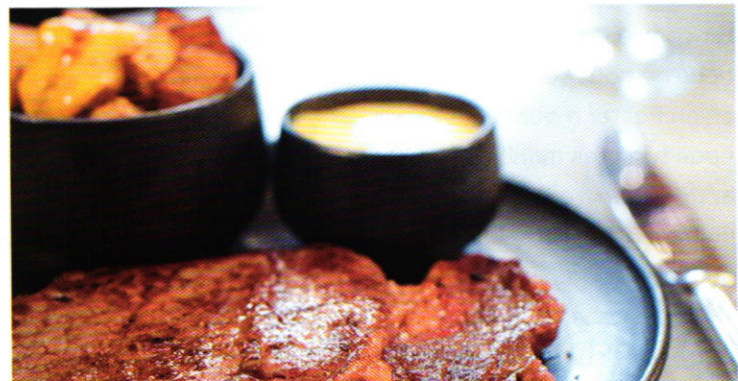
Aux Prés - 27 rue du Dragon 75006 Paris - 01 45 48 29 68

Dans cette gentille rue de Saint-Germain, se trouvent les Prés, un bistrot naviguant entre un Paris rétro et un New York chic, flanqué d'un bar superbe et habillé d'un papier peint d'époque au charme insolent. Les initiés aiment à y retrouver les assiettes voyageuses affichant au menu entrecôtes béarnaise et bouillon thaï...