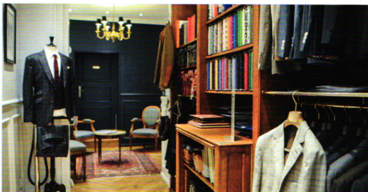
Artling - 55 rue des Saints-Pères 75006 Paris - 01 42 22 99 92