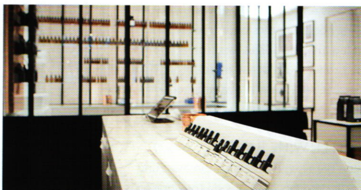
Codage Paris - 8 rue du Trésor 75004 Paris - 01 40 27 80 09

Vous êtes fâchés avec les soins esthétiques ? Là, c'est autre chose. L'approche qui manquait : le sur-mesure des soins de la peau. On file donc débiter cette journée chez Codage Paris où l'on va vous concocter la préparation cosmétique qu'il vous faut. Comme chez votre tailleur, vous en repartirez avec un petit pot de crème unique au monde. Le vôtre.